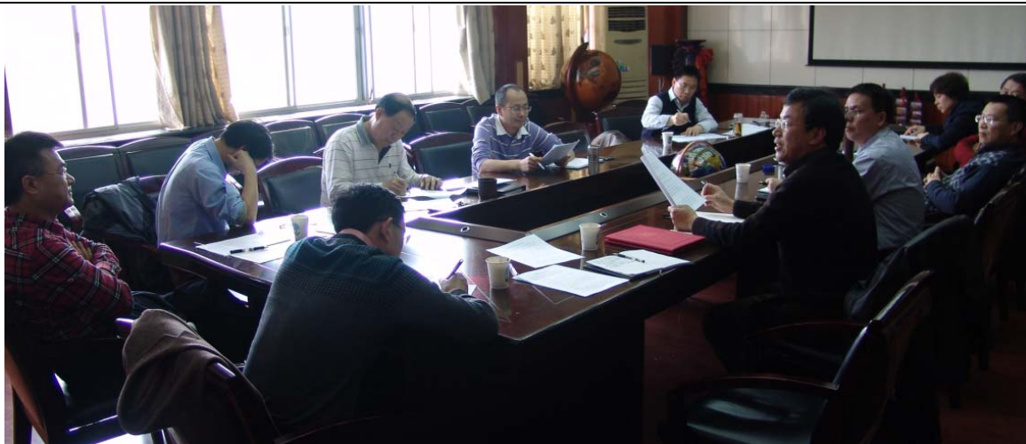
2014年3月27日地学院召开科研团队组建班子务虚会，邀请2个国家重点实验室负责人参加，开启试点改革务虚工作模式。