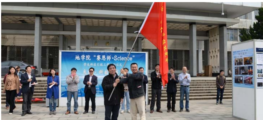
4月20日，“赛恩师”杯地学知识竞赛暨《第三届全国大学生地质技能竞赛》选拔赛启动，中国地质大学（武汉）竞赛队组建，副校长赖旭龙教授代表学校授旗。“赛恩师·Science”是以“良师·科技·成长”为主题的地球科学学院学生科技领航工程。